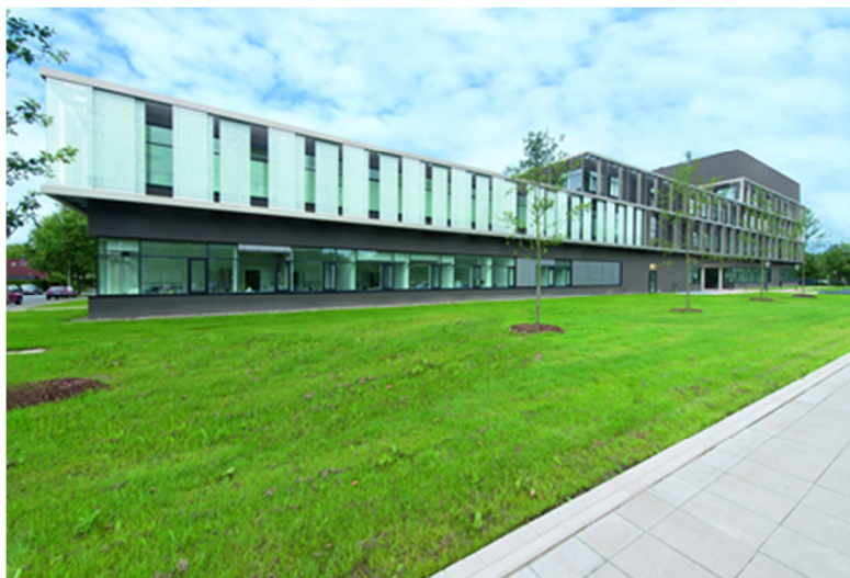
Außenansicht: CRC Hannover, Feodor-Lynen-Straße 15, 30625 Hannover

Barrierefreies Parken auf speziell gekennzeichneten Flächen ist direkt vor dem Gebäude möglich. Die Untersuchungsräume befinden sich im Erdgeschoß und sind rollstuhlgerecht. Ein behindertengerechtes WC ist vorhanden.